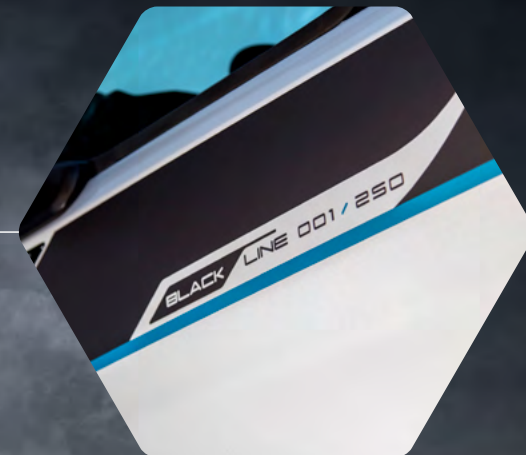
Sériové číslo F-MAX BLACKLINE