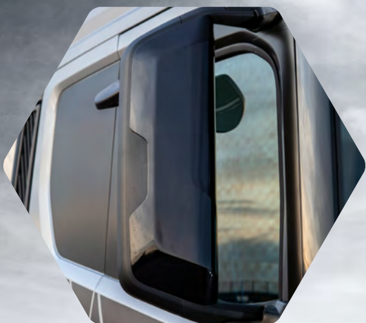
Černě lakovaná zrcátka

F-MAX BLACKLINE byl vyroben v limitované edici pouhých 250 kusů a je tu proto, aby vašim cestám dodal maximální prestiž. Ford Trucks zdůrazňuje stylový faktor robustního podvozku tohoto vozu s detaily, jako jsou černá zpětná zrcátka, černé LED světlomety a kontrastní modré akcenty. Nekompromisní filozofie designu společnosti Ford Trucks proměnila F-MAX BLACKLINE v nákladní vozidlo ve stylu sportovního vozu. A s vynikajícím hnacím traktem jej lze popsat jedním slovem - dokonalost.