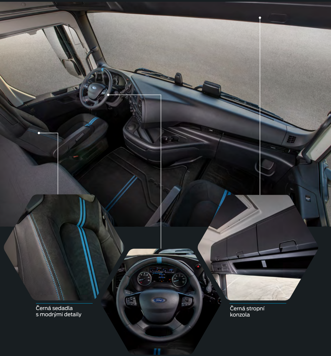
Černá sedadla s modrými detaily

Interiér kabiny navazuje na designové téma z exteriéru vozu, s výraznými modrými liniemi na sedadlech a černým koženým volantem. F-MAX BLACKLINE je konstruován pro maximální pohodlí i pro nejnáročnější cesty. Tento jedinečný vůz nastavuje nový standard ve své třídě.