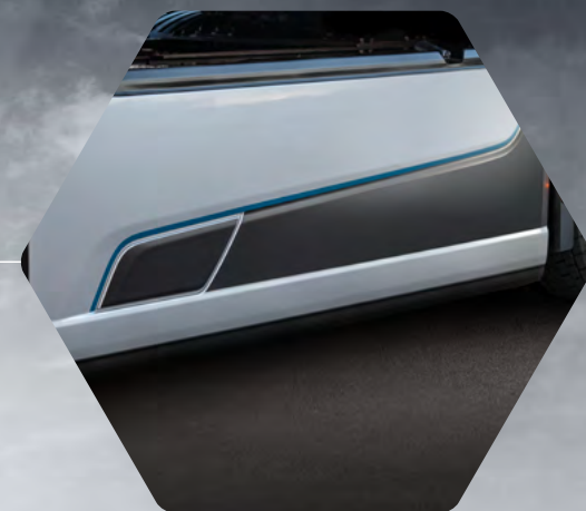
Boční spoiler s černo-modrými detaily